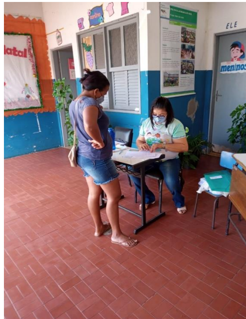
CRECHE MUNICIPAL REI DAVI