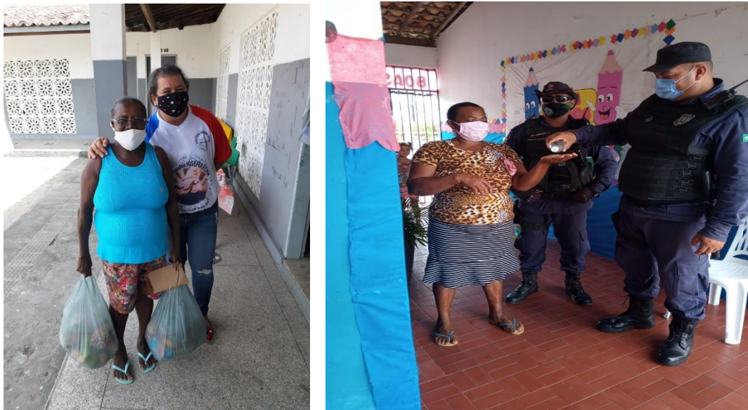
ESCOLA MUNICIPAL BRANCA DE NEVE