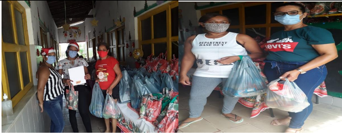
ESCOLA MUNICIPAL JOSÉ FERREIRA