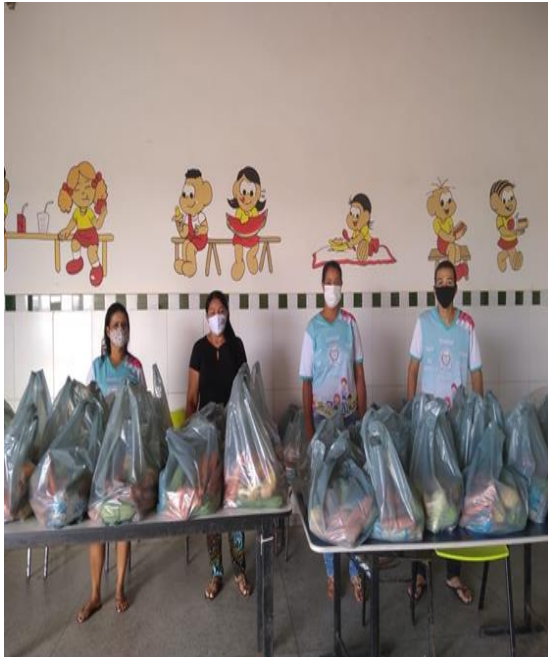
ANEXO DO REI DAVI (CRECHE DO MIRANDA)