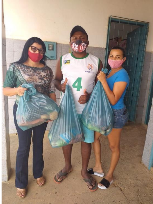
ESCOLA MUNICIPAL CONCEIÇÃO BARRETO