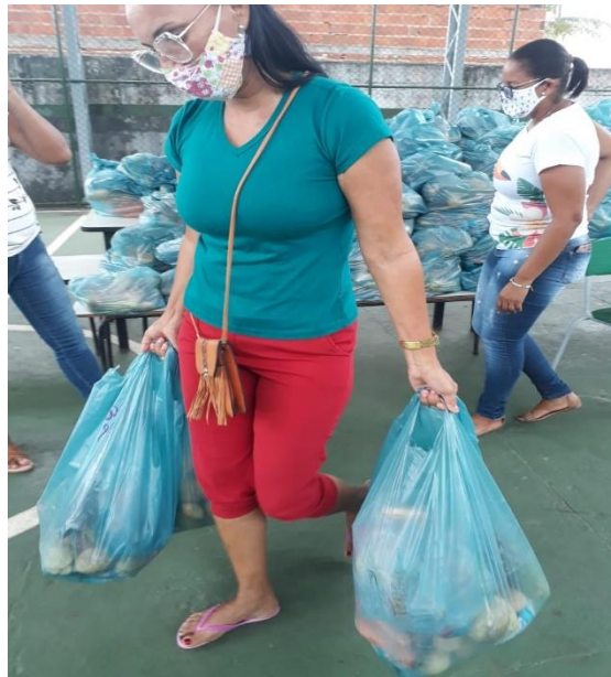
ESCOLA MUNICIPAL MARIA DO CARMO NASCIMENTO